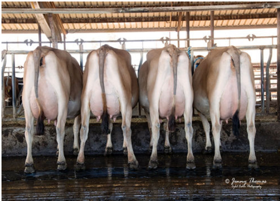
TENPENNY DAUGHTER GROUP

L TO R - PROGENESIS MARACHUTE, JX VIERRA NOI(5), PROGENESIS DOROTHY, PROGENESIS MARYPOPPINS